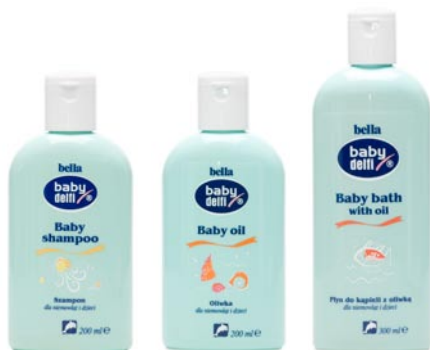
▲ Kosmetyki Bella Baby Delfi zostały stworzone specjalnie dla delikatnej i wrażliwej skóry dziecka.