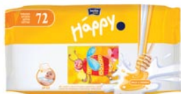
▲ Chusteczki nasączone Bella Baby Happy do pielęgnacji ciała dzieci już od pierwszych dni życia.